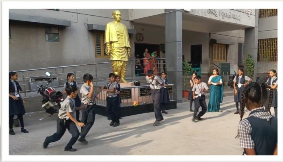
મેદાનમાં રમતા બાળકો