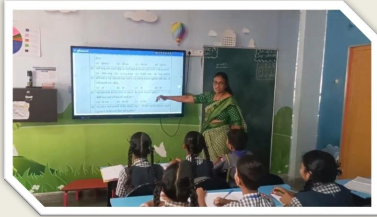
સ્માર્ટ ક્લાસનો ઉપયોગ કરતા શિક્ષકો